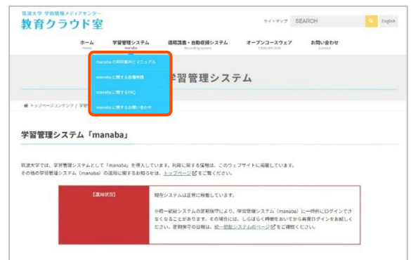
サポートサイト画面

また、システムの稼働状況など、教育クラウド室からのお知らせも随時掲載しています。