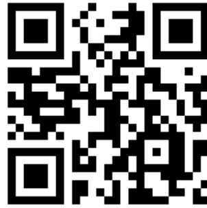
ログインページにアクセスするためのQRコード

! ブラウザを閉じないと、ログインしているユーザIDを無認証で利用継続されてしまうことがあります。